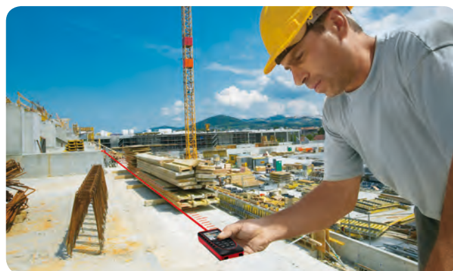
Misurazione di lunghe distanze