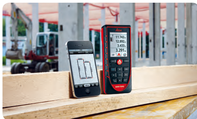
Trasmissione dei dati con Bluetooth® Smart