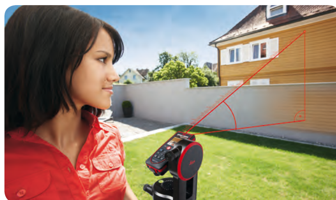
Smart Horizontal Mode™