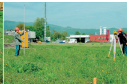
Livellamento di superfici

Leica Jogger è il partner ideale per tutte le livellazioni .