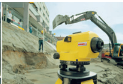
Misure di profili